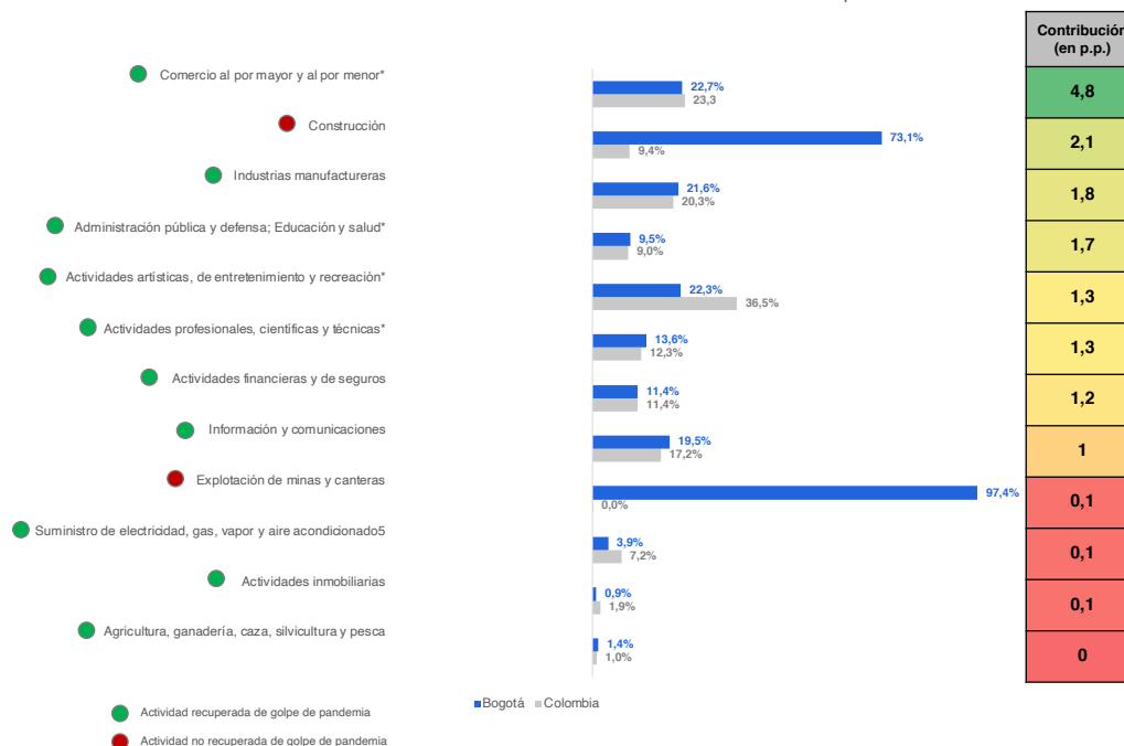
Gráfico 2. Tasa de crecimiento anual acumulada por sectores