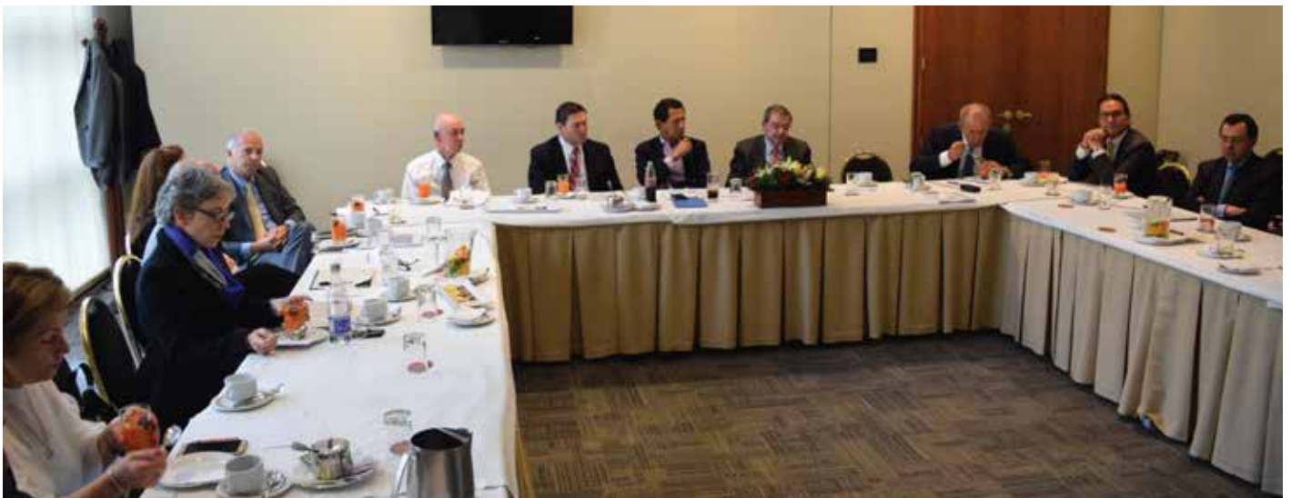
Sesión de planeación estratégica. Miembros del Consejo Directivo de ProBogotá, 25 de Septiembre de 2018. Club el Nogal