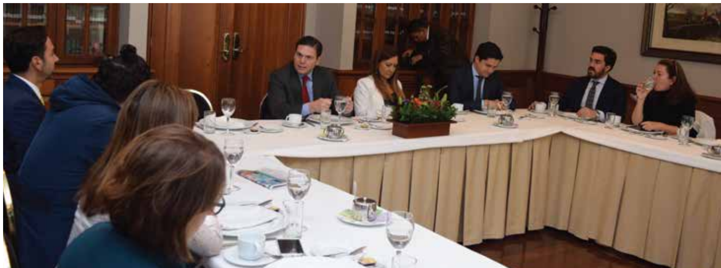
Desayuno con a bancada de Bogotá en la Cámara de Representantes.